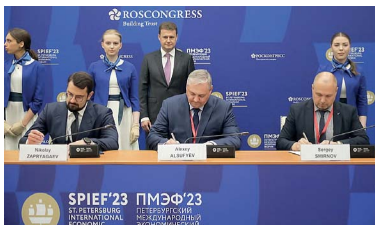
Соглашение о сотрудничестве при создании нового высокотехнологичного судоремонтного предприятия подписали на ПМЭФ-2023

Планируется, что судоремонтный комплекс сможет обслуживать целевой сегмент, включающий более чем 200 судов — морских и смешанного плавания. Это 40% всего арктического флота, который, по оценкам экспертов, будет сформирован в количестве 800 судов