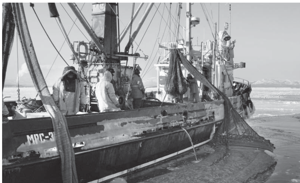
Охотнее всего курсанты идут на практику на современные суда, где работают отличные специалисты с большим опытом

дуть в рейсы дважды. Первый раз — в 2021 году, когда учился на четвертом курсе. «Был на должности матроса-рулевого, исполнял обязанности на мостике», — рассказал он. Работу молодого специалиста контролировали капитан, старпом, второй и третий помощники капитана.