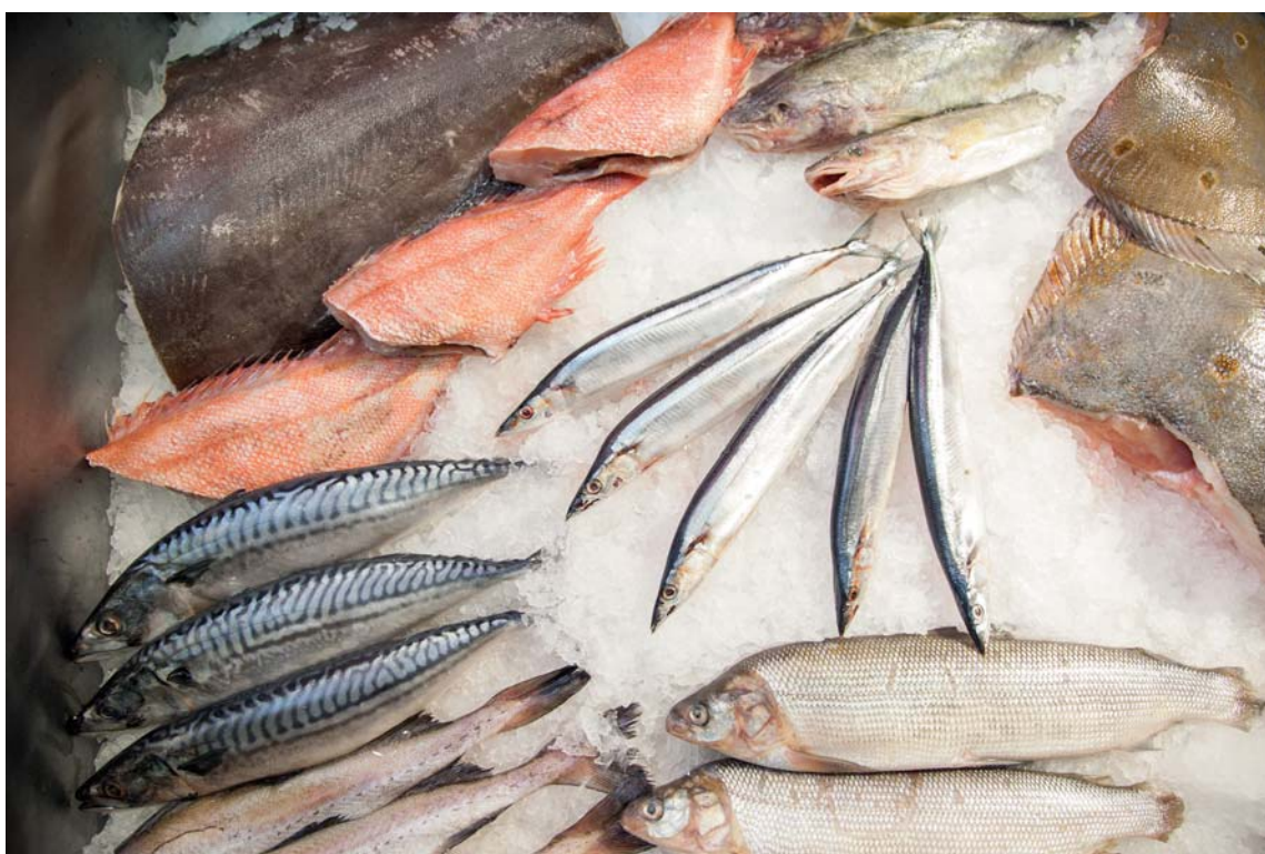
Исследования показывают, что россияне потребляют недостаточно жиров животного происхождения

Такие суперпродукты, как скумбрия, помогают корректировать структуру потребления жиров, которая в России (как и на глобальном уровне) очень далека от идеальной. К сожалению, рыночные механизмы зачастую закрепляют искаженную структуру потребления жиров. Популяризация потребления жирной рыбы должна оставаться в приоритете у государства и соответствующих отраслевых объединений.