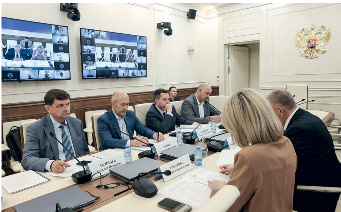
Межкомитетская рабочая группа Совета Федерации обсудила документы для запуска второго этапа инвестиционных квот и крабовых аукционов

Власти Камчатки выразили опасения, что предприятия окажутся загнаны в жесткие рамки, не соотносящиеся с меняющейся рыночной ситуацией. «Мы не против того, чтобы стимулировать глубокую переработку — мы против того, чтобы завязывать жестко эти условия, которые могут быть не согласованы с требованиями рынка», — объяснил министр рыбного хозяйства реги-