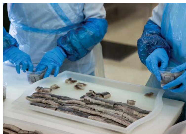
Скумбрия — чрезвычайно простой в приготовлении продукт, с которым справится даже начинающий повар

Фактически эксклюзивным источником EPA является жирная морская рыба, обитающая в холодных водах. Лучшими породами рыб, содержащими эту жирную кислоту, являются