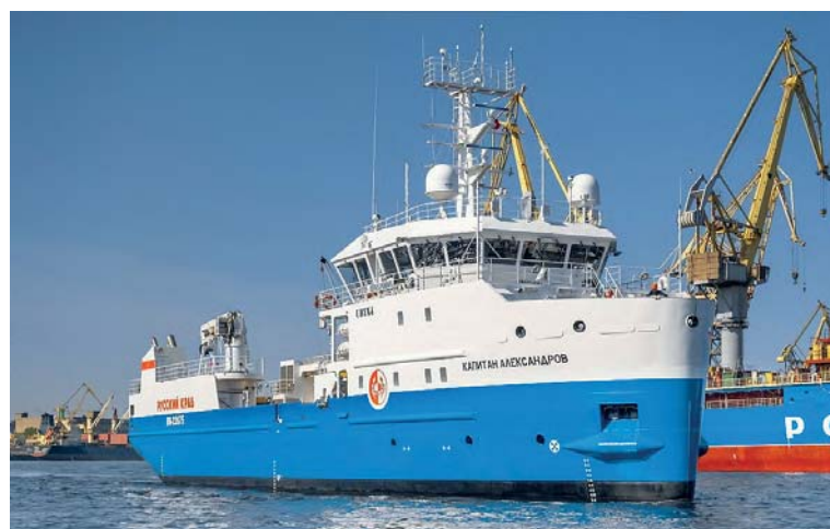
Флаг России на судне «Капитан Александров» подняли в Санкт-Петербурге

Онежский завод передал судно заказчику в марте. Сообщается, что в ближайшее время живовоз перейдет по Северно-