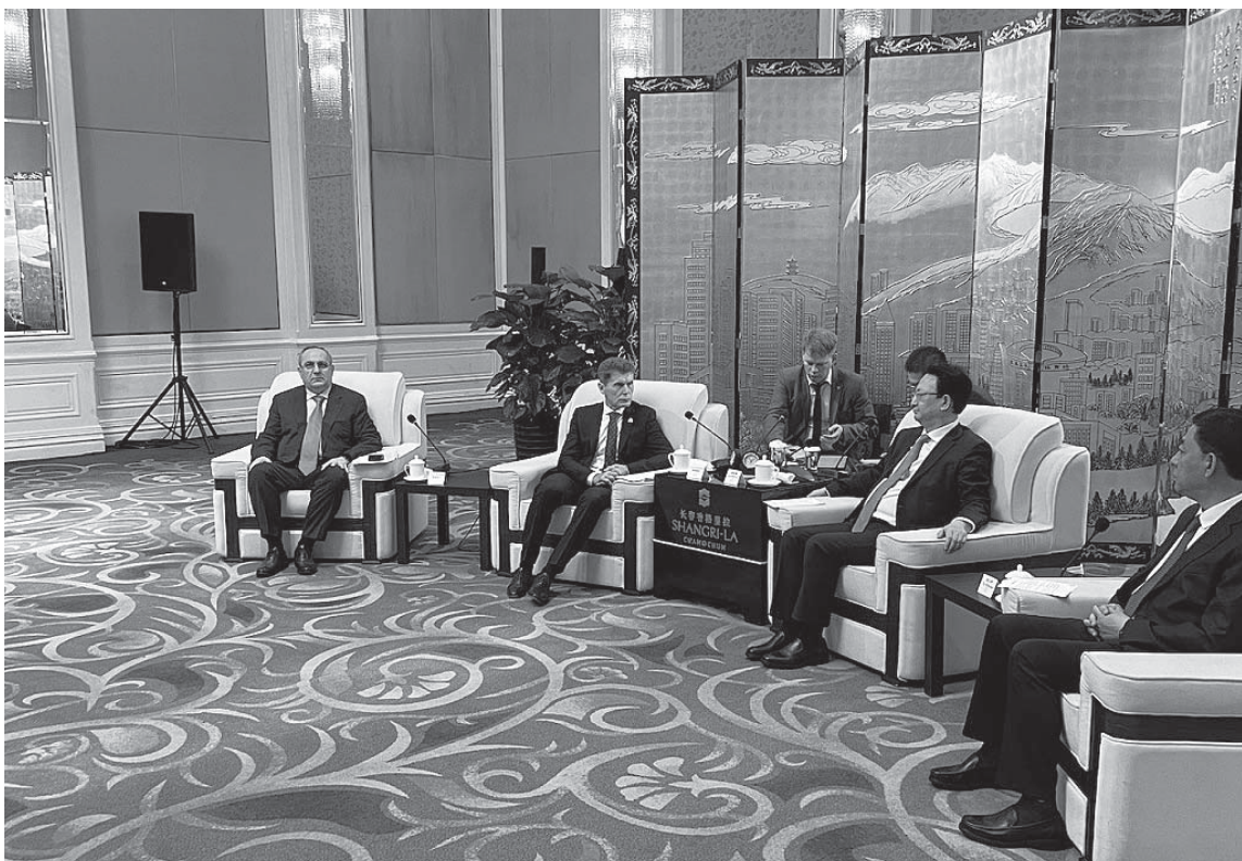
Губернатор Приморского края Олег КОЖЕМЯКО обсудил логистические проекты с китайскими представителями на встрече в Чанчуне