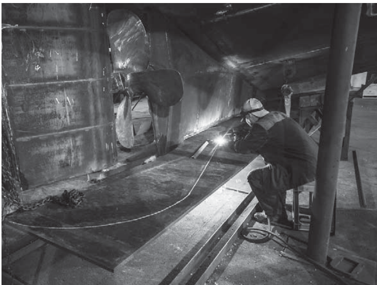
В Совете Федерации обратили внимание на важность развития докового хозяйства и создания отечественного судового оборудования

Напомним, что в первом чтении законопроект был принят в феврале. Ко второму чтению документ прошел доработку — помимо технических и уточняющих правок добавлено условие о сроках заключения инвестиционного соглашения о модернизации, которое предприятие заключает с федеральными властями. FN